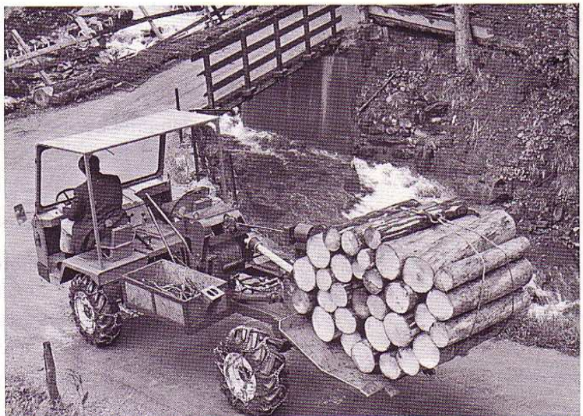
Muli beim Transport von Schichtholz im Huckepack-Verfahren

Die Forstausrüstung wurde so ausgeführt, dass der Muli ohne grosse Umstellung die ganze Holzbringung mühelos bewältigt: Seilzugarbeit – Heben, Rücken und Schieben mit dem hydraulisch betätigten Schild – Schichtholz- und Langholztransport. Nebst diesen spezifischen Forstarbeiten kann der Muli aber auch für die Schneeräumung und den Strassenunterhalt eingesetzt werden.