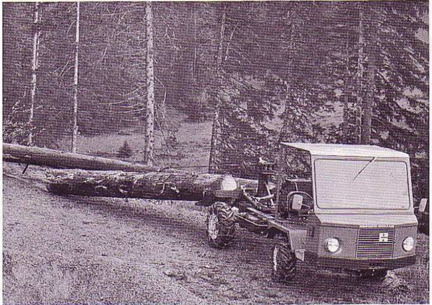
Muli beim Rücken von Langholz