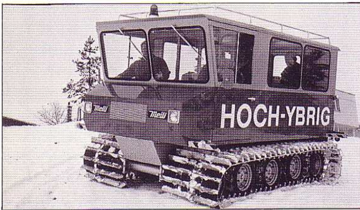
Meili-Raupenfahrzeug als Personentransporter, Kapazität: bis 12 Personen.