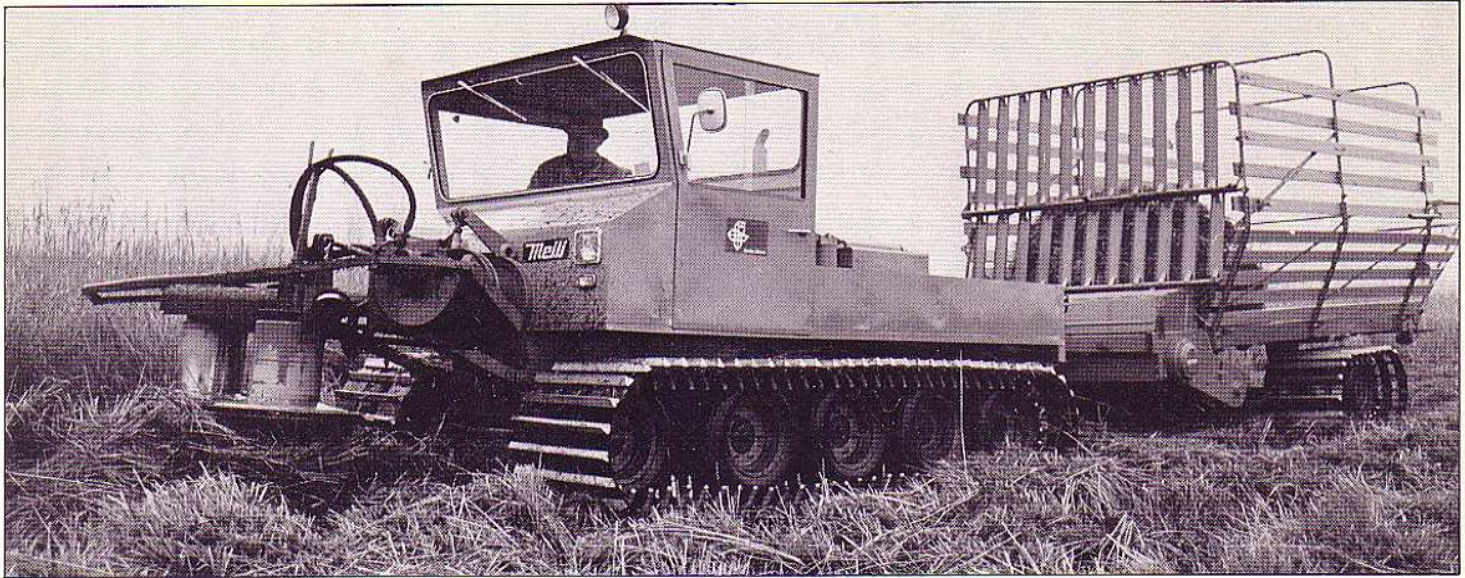
Meili-Raupenfahrzeug im Einsatz als Schilfmähmaschine in Sumpfbereichen.