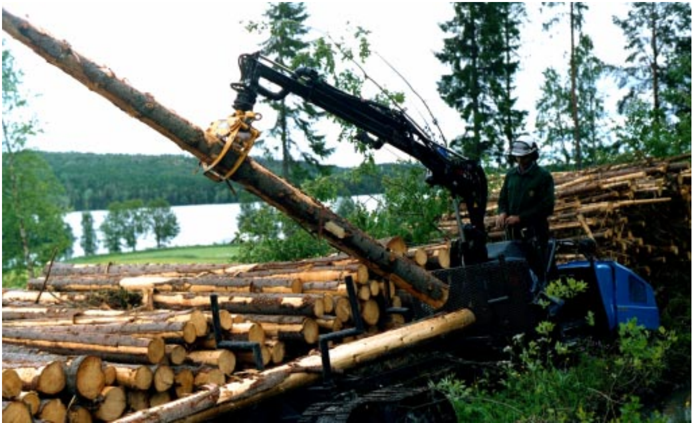
Skogis 2000 med hydraulisk griplastkran