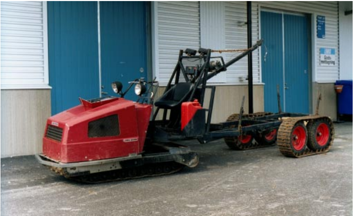
Skogis 2000 med vinchkran