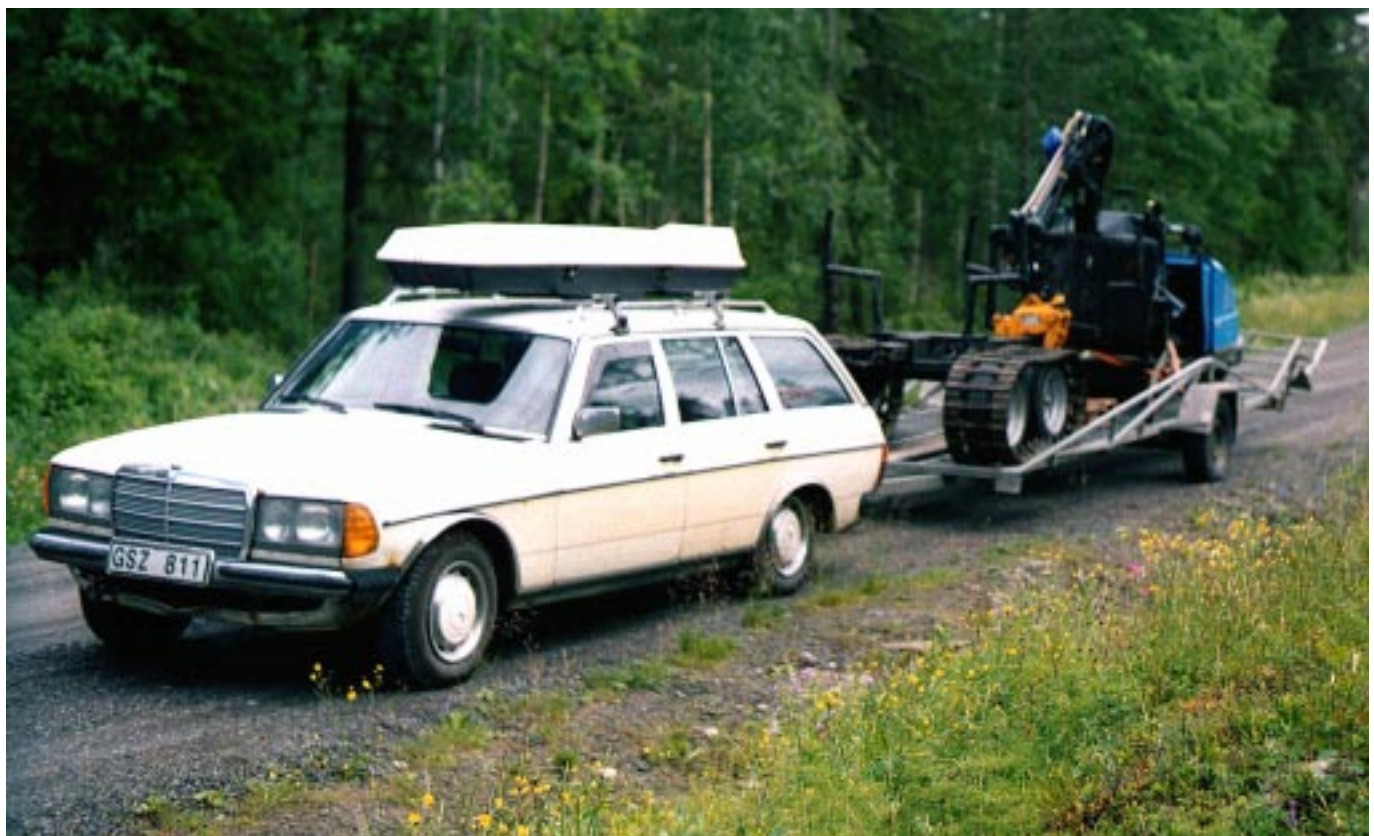
Skogis 2000 upplastad på släpkärra