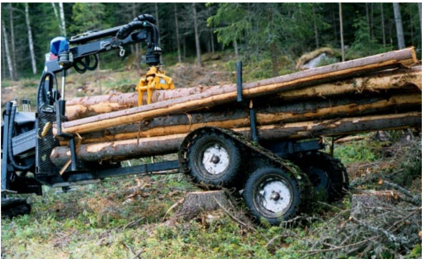
Skogis 2000 "flyter" fram i svår terräng, såväl sommar som vinter