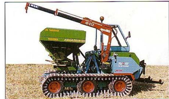
Outil : position centrée