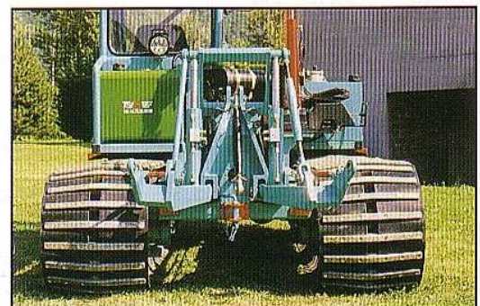
Pression au sol : 80 g/cm 2

A chaque tour de chenille, les orifices de dégagement, indispensables à l'évacuation des boues et cailloux, suppriment tout risque de patinage entre pneus et chenilles.