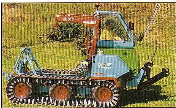
6 ou 8 roues

L'EUROTRACK EST LE PREMIER ENGIN LÉGER SUR CHENILLES CAPABLE D'ANIMER DES OUTILS A PARTIR D'UN RELEVAGE 3 POINTS COUPLÉ A UN CHARIOT MOBILE.