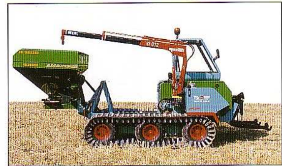
Outil : position haute