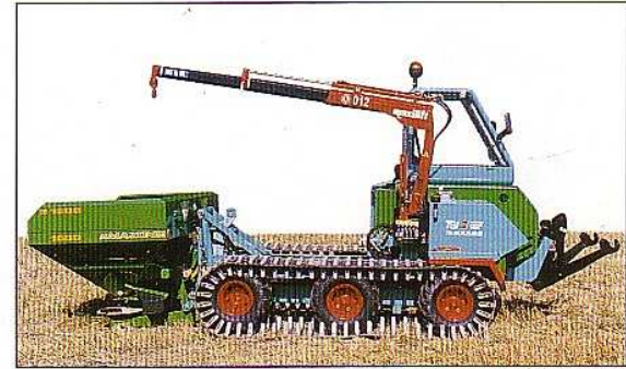
Outil : position au sol